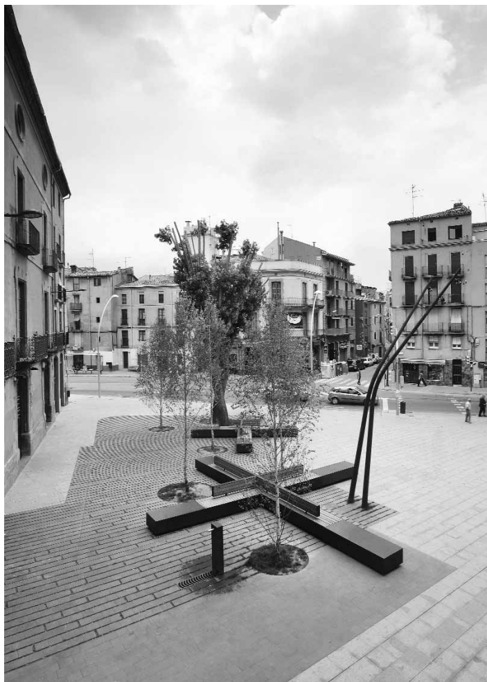
Urbanització de la plaça Valldaura

Aquestes tres línies d'actuació pretenen recuperar la vitalitat urbana d'un barri en el qual àmplies zones es trobaven en un estat de degradació física i social important.