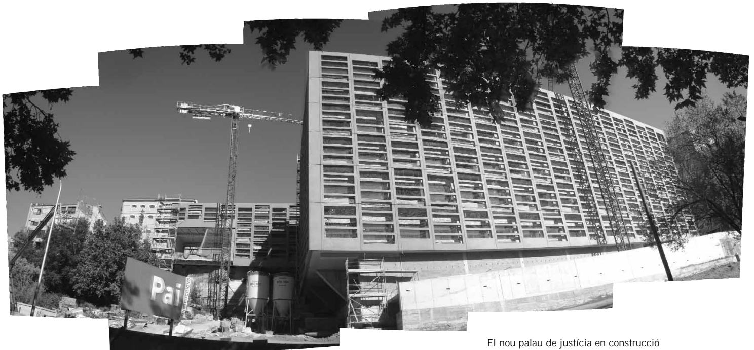
El nou palau de justícia en construcció

completar l'actuació de la plaça Immaculada i en la qual actualment es troba en fase d'obres l'actuació al voltant dels carrers Montserrat i Sant Antoni; i la tercera, la situada al llarg del carrer Arbonés, en la qual una part de les compres i enderrocs d'edificacions han permès ja la implantació del nou palau de justícia i en la qual, la part destinada a la regeneració d'habitatge, es troba en fase d'adquisició i enderroc de finques.