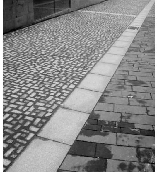
Materials de pavimentació per al centre històric