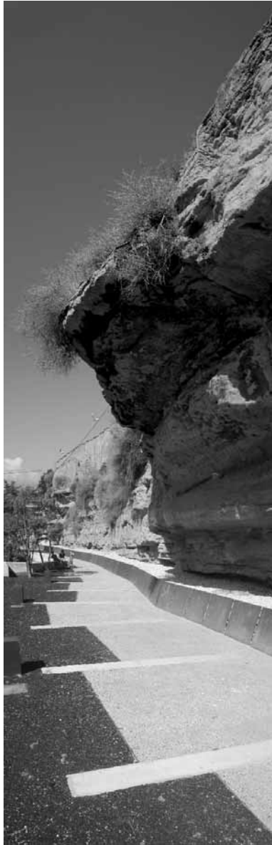
Urbanització del camí dels Corralis

estan encaminades a mantenir i a reforçar aquests trets. En aquestes operacions de renovació de l'edificació, l'objectiu fonamental se centra en reforçar aquests trets generals del teixit (complexitat, fragmentació visual, riquesa espacial, caràcter tectònic dels edificis...). El llenguatge arquitectònic de l'actuació pot ser clarament contemporani.