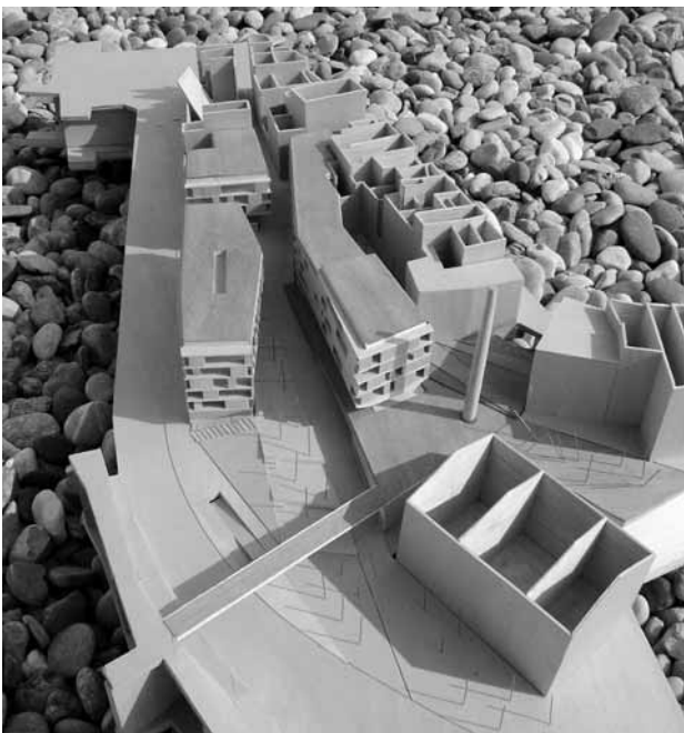
Pla de renovació urbana del carrer Montserrat i camí de la Cova

La intervenció pública municipal destinada a la transformació i revitalització urbanística del centre històric de la ciutat s'inicià ara fa ja uns 15 anys. Tanmateix, és en els darrers anys, del 2004 ençà, que les actuacions públiques de transformació urbana del nucli antic de Manresa han pres més embranzida. L'embranchida i la intensitat de projectes executats i iniciats des d'aquesta data ha estat possible, per un costat, per l'aportació de recursos econòmics provinents del Pla de millora de barris de la Generalitat i, per l'altre, per la feina prèvia acumulada en planejament urbanístic, en adquisició de sòl i en actuacions de rehabilitació urbana.