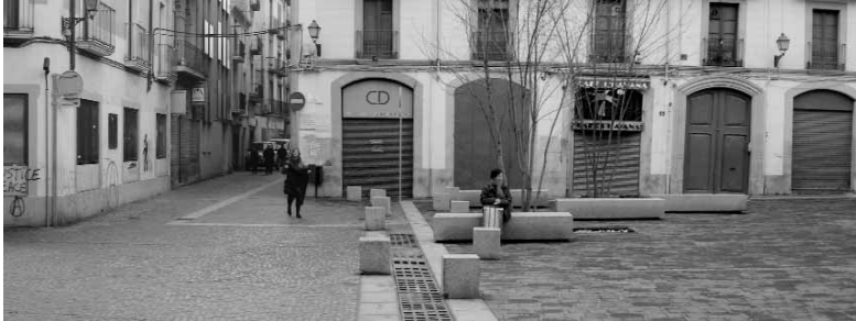
Urbanització de la plaça Gispert