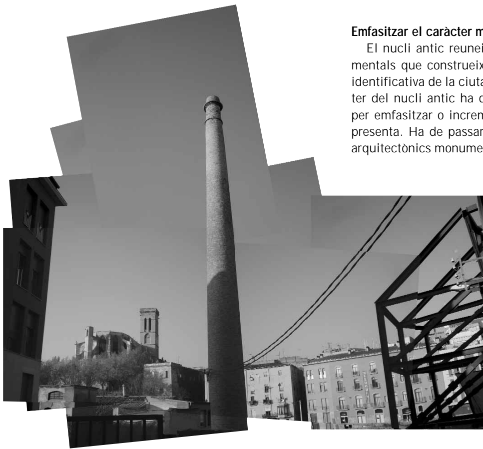
Obertura de vistes cap a la Seu des del carrers Escodines i Sant Bartomeu

lor negros; i, el més singular, el formigó blindat amb granit (una versió actualitzada d'un paviment històric de la ciutat, utilitzat als anys 20 i 30 del segle XX, el qual, després de 80 anys, encara presenta un comportament excel·lent).