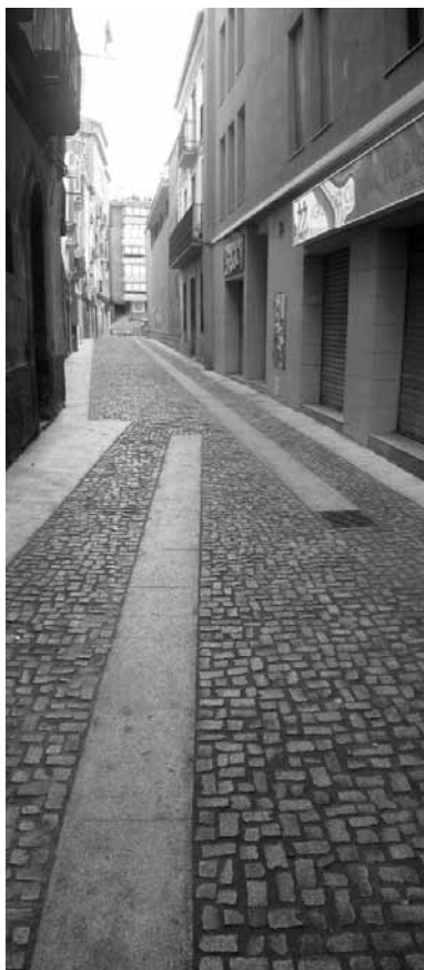
Urbanització del carrer Talamanca