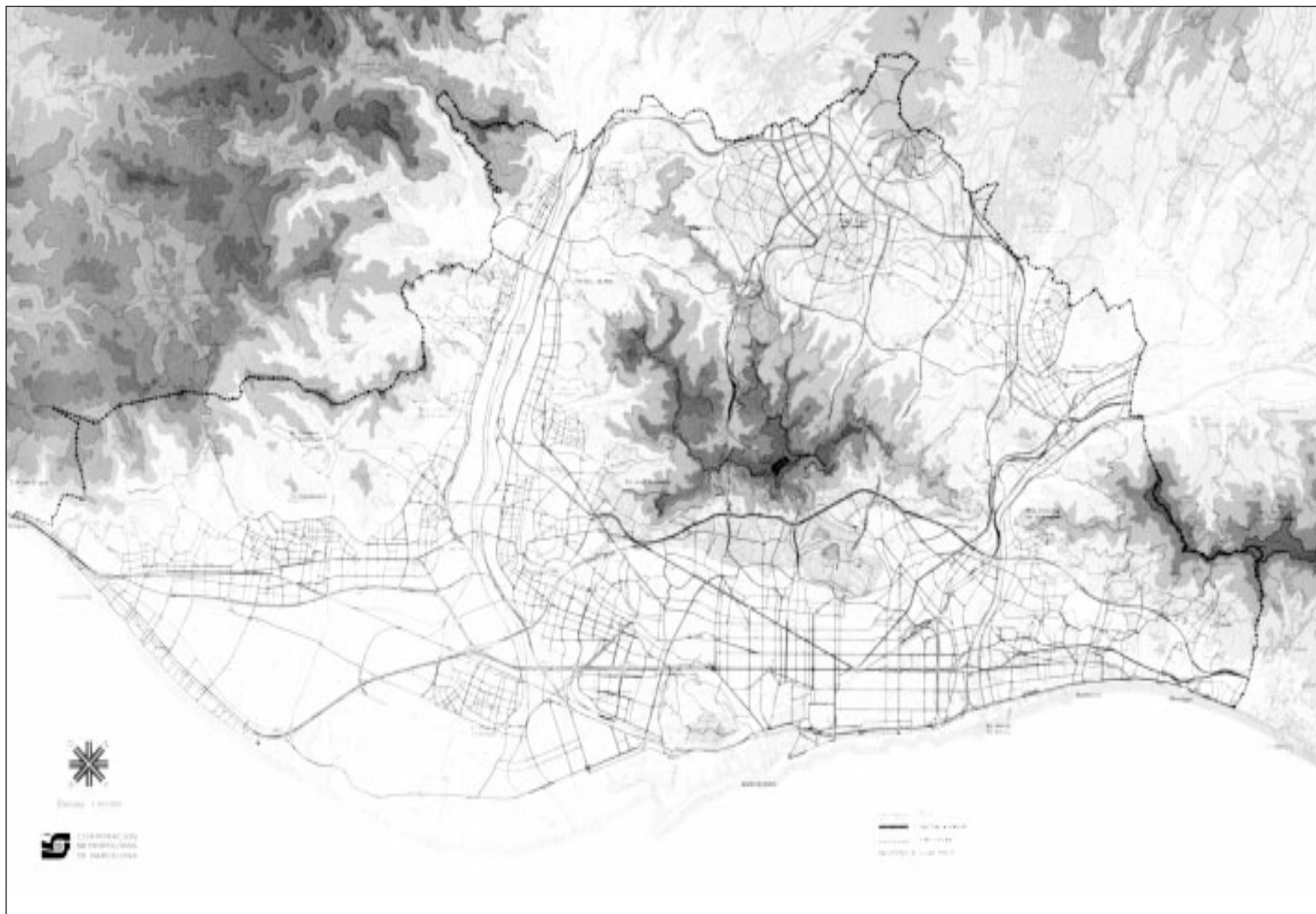
Figura 3. Pla General Metropolità d'Ordenació Urbana. Sistema viari bàsic